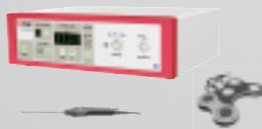
TEKNO SHAVER SYSTEM