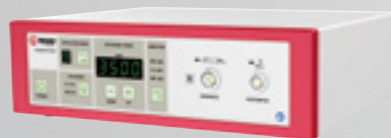
CONTROL UNIT TM940

*Diese Funktion erlaubt es eine gewünschte Position des Blades festzulegen, in welche es jederzeit nach der Rotation zurückkehrt.